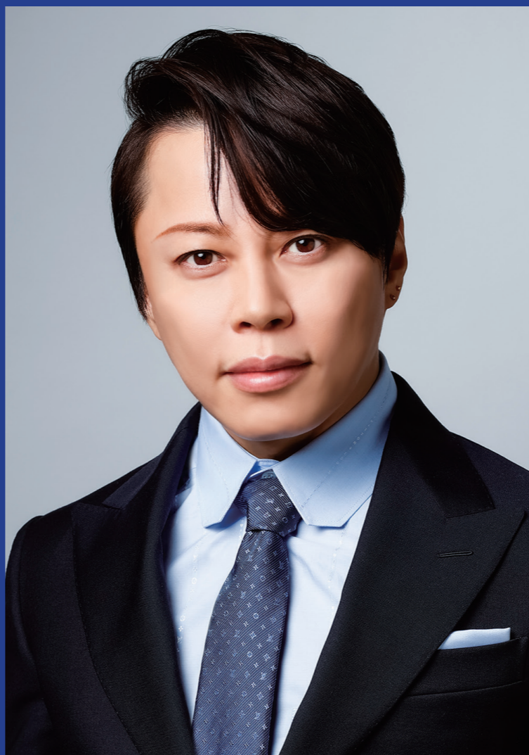
パーソナリティ 西川 貴教